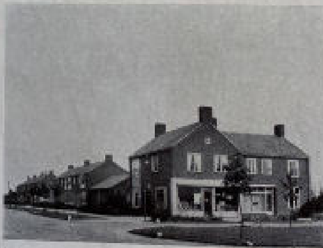
De Lange Brink

Openbare en Prot. Chr. lagere scholen: Directie van de Wieringermeer.